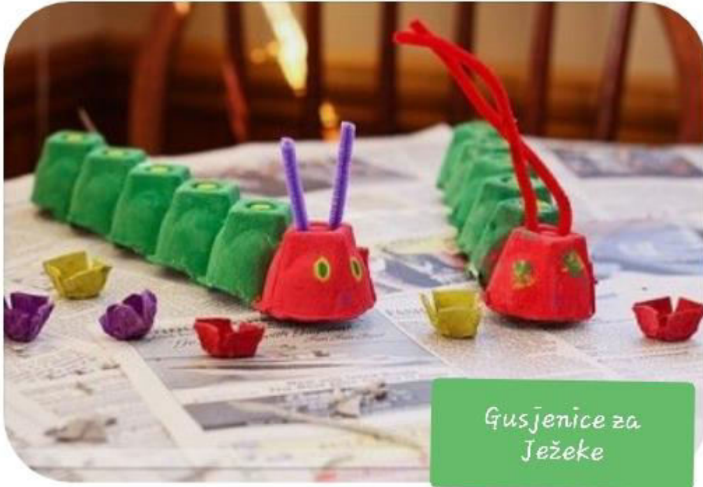
Gusjenice za Ježeke